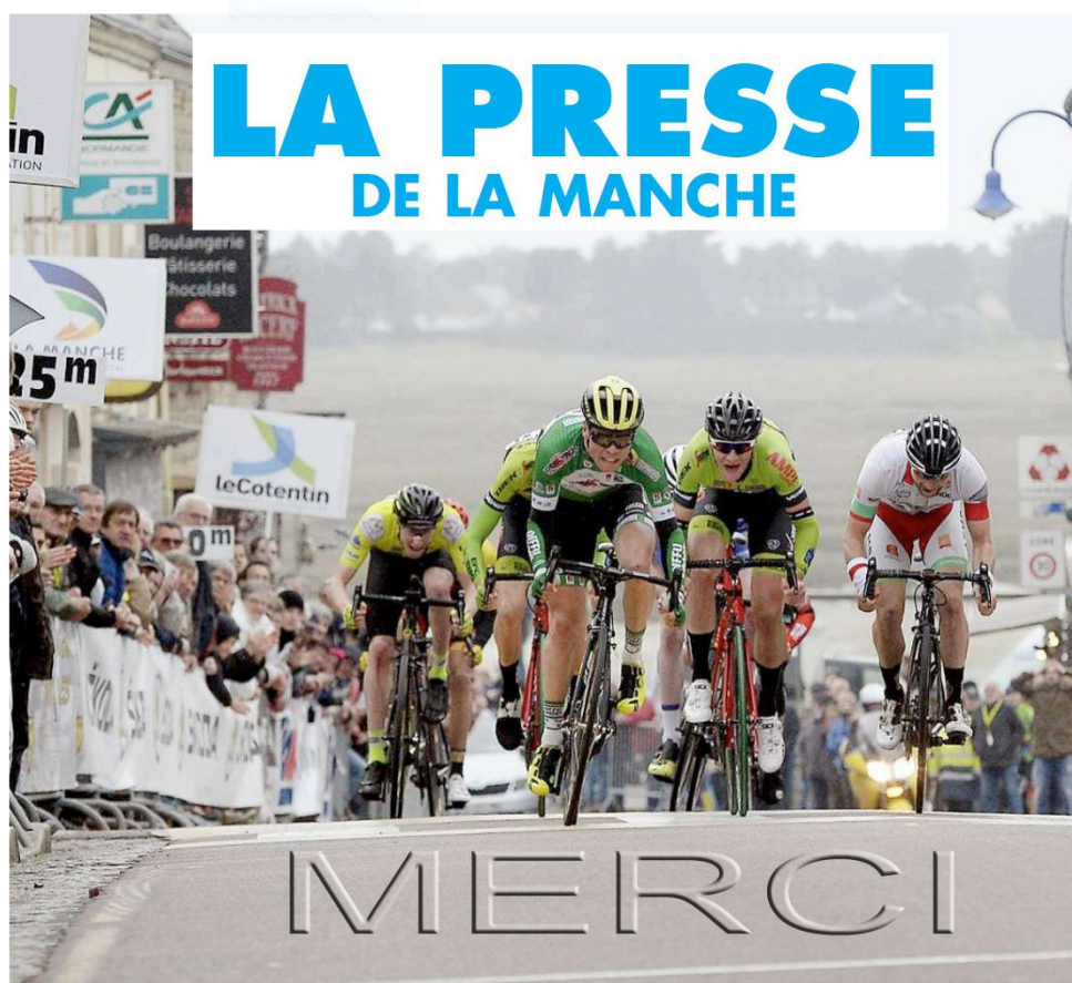
→ Le 13 avril, la Gainsbarre, à Portbail, est l'un des rendez-vous à ne pas manquer du début de l'année dans la Manche.

31 : Sainte-Geneviève : Ecoles de vélo (AS Tourlaville).